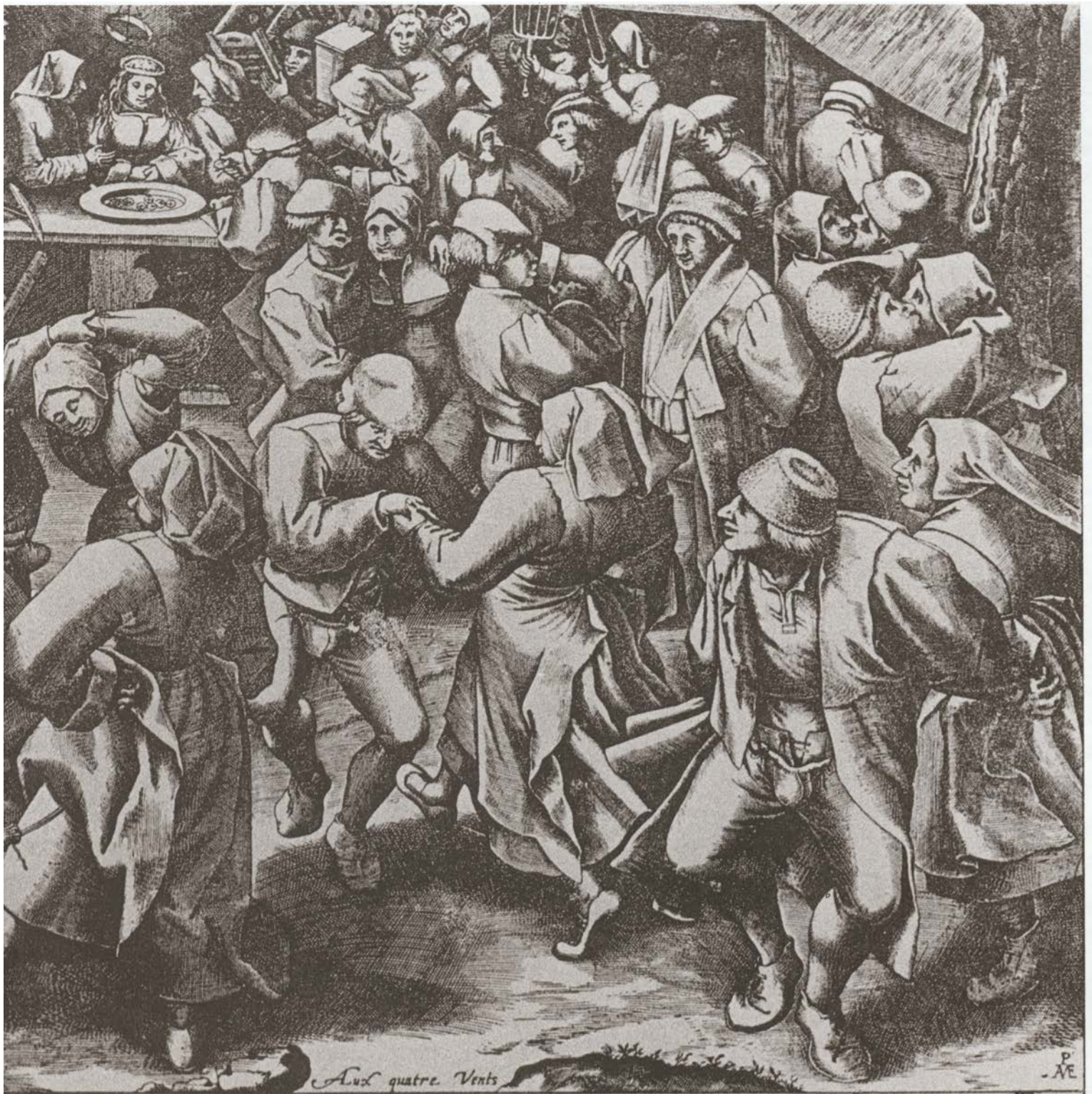
Aux quatre Vents

תגיגה כפרית. תחריט של ברויגל האב. החגיגות השרו את שגרת החיים של עבודת האדמה וסייעו לפירוק מתחים.