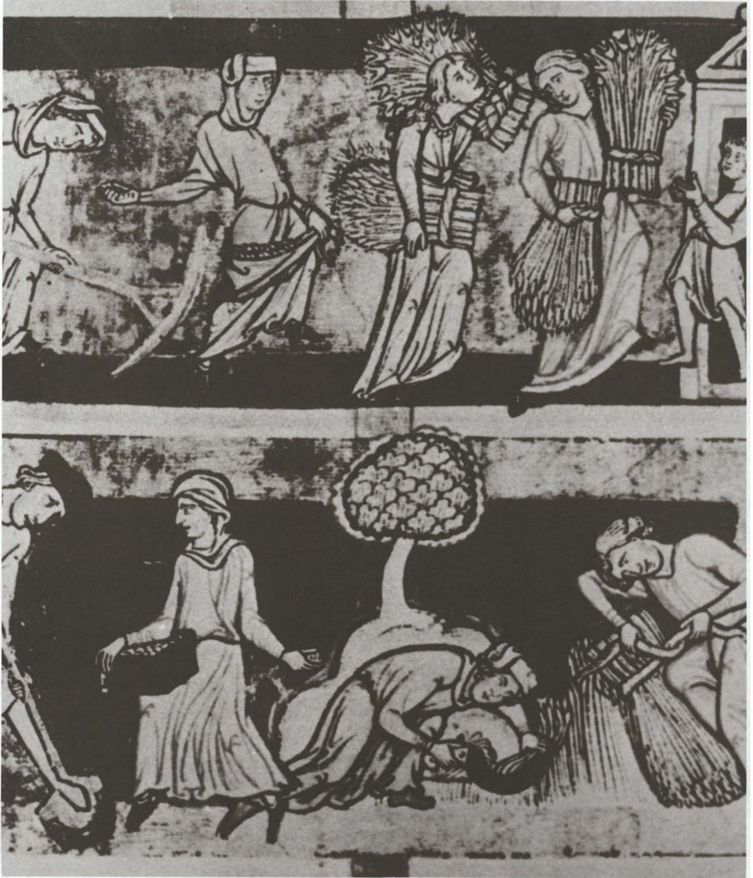
תמונה כפרית. איור לכתב-יד מן המאה ה-12. גברים ונשים עבדו יחד בעבודות השדה, אך שמרו בדרך כלל על ריסון מיני.