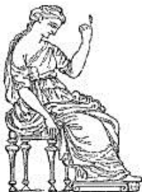
cathedra supina △

סוגים שונים של שרפרפים, מתקפלים ולא מתקפלים. 31 השרפרף (או הכיסא) המתקפל שנועד לאירועים רשמיים ונקרא 'סֵלָה קוּרוּלִיָּה' (sella curulia) אינו חשוב לעניינינו וכך גם 'סֵלָה גֶסְטָטוֹרִיָּה' (sella gestatoria) שהיה כיסא אפרוין. סוגים רבים של sellae נמצאו בבתיים רומיים, בנוסף ל-'בִּיסְלִיוֹם' (bisellium), שהיה מושב גדול והספיק לשני יושבים. ה-'קְלִיסְמוֹס' התפתח ל-'קְתֵדְרָה' (cathedra), שהיה כיסא עם משענת גב ושימש לרוב את הנשים, בעוד שהסֵלָה שימש את שני המינים גם יחד. 32