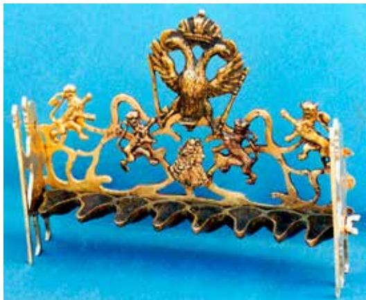
תמונה 3) מנורת חנוכה עם קארל השישי. אוסטריה, 1750 לערך

מוטיב נפוץ אחר, אשר חשוב להבנת השינוי שחל בעיצוב המנורות במדינת ישראל, קשור לסמלים הלאומיים המופיעים על המנורות. שוב מדובר במוטיב מקומי – באיטליה של הרנסנס אלו סמלי האצולה של קרדינלים איטלקיים שהעניקו חסות ליהודים במקומות שתחת שיפוטם; באוסטריה המוטיב הוא נשר בעל ראש אחד; בפולין וברוסיה נשר דו־ראשי, ואילו במנורות מעיראק נמצא סהר וכוכב – סמל האימפריה העות'מאנית. 8 לעתים, לצד הסמל המלכותי הופיע שמו של השליט, כגון במנורה עממית שהדופן האחורית שלה עוצבה מקסדה צבאית בזמן מלחמת העולם הראשונה, ובחזיתה גולפו בגדול האותיות FI משמאל ו־MT מימין – ראשי התיבות של פרנץ יוזף ומריה תרזה (המנורה שמורה במוזיאון יהדות איטליה בירושלים). במנורה אוסטריית נדירה אחרת אף נמצא את דיוקן אביה של מריה תרזה, הקיסר קארל השישי (1685–1740), מגולפת מעשה מקשה מתחת לנשר הדו־ראשי (תמונה 3). 9 שיבוץ סמלים זרים אלה מגלם תופעה ידועה באמנות היהודית: הבעת תודה, ולעתים אף רגשות אהדה, של היהודים לנותני חסותם במקומות ובזמנים שונים, מעין תפילה לשלום המלכות. 10 במנורות חנוכה יש לתופעה זו ממד נוסף, באשר