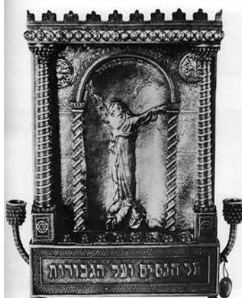
תמונה 5) מנורת חנוכה עם דמות מתתיהו על פי פסלו של בוריס שץ (על פי תצלום השמור במוזיאון ישראל, ירושלים)

את חרב המרד גבוה מעל לראשו. 15 אמנם מקומו של פסל זה אינו ידוע היום, אך דימויו מופיע ברופן האחורית של מנורת חנוכה שנוצרה ב'בצלאל' עשורים אחדים מאוחר יותר (תמונה 5). 16 במנורות 'בצלאל' המוקדמות נעשה ניסיון לשלב בין המסורות האיקונוגרפיות של העבר לאיראלים החדשים. בטיפוסים הנפוצים, שנעשו על ידי קבוצת שראר (או שרא"ר) 17 במספר רב יחסית של עותקים, רקעו האמנים מוטיבים שהיו מוכרים באמנות היהודית המסורתית, בייחוד ממזרח אירופה, כמו צמד אריות הרלדיים ומנורת שבעת הקנים. לצדם מצויים תבליטים של מטבעות