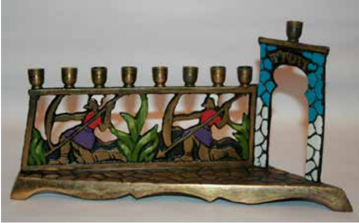
תמונה 26) מנורת חנוכה עם חיילים מכבים, 'רות', שנות החמישים של המאה העשרים

רק מעט מנורות מציגות ילדים, ולא דווקא ילדים 'חילונים'. 59 כך למשל באחת המנורות נמצא ילדים חובשי כיפות מדליקים נרות במנורה דמוית מנורת המקדש שבקשת טיטוס (תמונה 27). ייתכן שהסיבה למיעוט דמויות הילדים אינה עניין של 'הזנחה' אלא פשוט משום שיוצרו עבורם מנורות מיוחדות, קטנות יותר, שבהן אפשר להדליק את הנרות הדקיקים, כמאמר שיר הילדים 'נר לי דקיק', פרי עטם של לוי קיפניס (מילים) ודניאל סמבורסקי (לחן). כמו כן, על מנורות אלו ודומיהן נמצאו הסמלים שהזכרנו אשר לאורם נתחנכו הילדים, וכן דימויי החיילים – דגם החיקוי לילדים. על מנורה קטנה וצבעונית אחת מראשית שנות השישים שנועדה כנראה לילדים, נמצא למשל חייל וחיילת שכל אחד מהם אוחז ביד אחת את דגל המדינה וביד השנייה רובה (תמונה 28), ואילו במנורה פופולרית אחרת הדימוי המרכזי הוא של חייל יחיד, האוחז בימינו ברובה ובשמאלו בתורן שעליו מתנפנף 'דגל חנוכה' בדמות דגל ישראל. 60 במנורות אחרות דמות החייל ניצבת מול דמות חלוץ. באחת המנורות שיוצרו לשנת העשור למדינה נראים חייל ורובה על שכמו מימין וחלוץ ומעדר על שכמו משמאל; שניהם תומכים בסמל המדינה הניצב ביניהם,