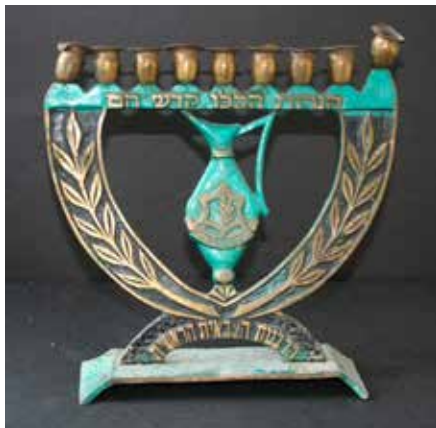
תמונה 20) מנורת חנוכה, הרבנות הצבאית הראשית, ישראל, שלהי שנות החמישים של המאה העשרים (אוסף שלום צבר, ירושלים)

זאת ועוד, אם בקרב היישוב הישן בארץ ישראל בית המקדש דמה למבנה מוסלמי, הרי כעת מראה המבנים השתנה. על מנורות אחדות הופיעו מדליונים קטנים עם מראות הקשורים בערי ישראל הנבנות, ובאחד המדליונים אף מופיעה מפת הארץ (תמונה 21). בין האתרים המודרניים נמצא בעיקר מבנים בירושלים כמו היכל שלמה – בניין הרבנות הראשית (נחנך ב־1958), ואף את משכן הכנסת החדש (נחנך ב־1966). 52 אך מרכזיים הרבה יותר הם אתרים מקודשים מן העבר הקשורים לירושלים ולסביבתה: הכותל המערבי, קבר רחל ומגדל דוד (תמונה 22). עוד לפני מלחמת ששת הימים נפוצו דימוייהם במנורות חנוכה, כמו גם במזכרות ובחפצי נוי עממיים רבים אחרים, תוך כרי תקווה שהובעה במפורש בכרטיסי ברכה לראש השנה 'שנת שחרור קדשינו'. על גבי אחת המנורות משנות החמישים נמצא מגדל דוד, סמל לעוז וגבורה, מוקף בפסוק: 'אם אשכחך ירושלים תשכח ימיני' (תהלים קלז 5). מאליו הובן באותן השנים המסר שאין להזניח את המקומות הקדושים, ושכמו המכבים בשעתם יש לעשות למען שחרורם מעול שלטון זר.