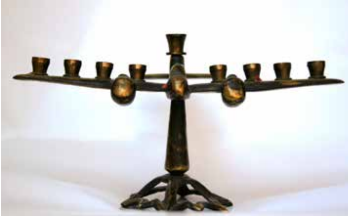
תמונה 33) מנורת חנוכה בצורת מטוס קרב, ישראל, שלהישנות השישים של המאה העשרים (אוסף שלום צבר, ירושלים)

וילד, וחלוץ במכנסיים קצרים (תמונה 30). כל הדמויות נושאות לפידים שבראשיהם בתי הנר, והם כולם צועדים לכיוון מגדל דוד – סמל לעוז ולחזוק. הקישור של חנוכה ומנורת החנוכה עם צבאיות וגאווה לאומית התעצם עוד לפני מלחמת ששת הימים, אך בעיקר לאחריה. הכותל המערבי שהופיע כמחוז כיסופים בשנים הקודמות תפס כעת מקום מרכזי בדופן האחורית של מנורות אחרות אשר תיארו חיילים או מתפללים ליד הכותל המשוחרר. מנורה אחת המתארת מתפללים אף נושאת את הכתובת: '7.6.1967 – יום שחרור בית קדשנו' (תמונה 31). 62 זהות זו בין חנוכה לצבאיות קיבלה תנופה בסוגה נוספת של מנורות אשר נוצרו בהקשר צבאי ממש. אמנם השימוש בתרמילי פגזים ובכדורים ליצירת חפצי נוי ידוע כבר מדור 'בצלאל' ואילך, אך בתקופה זו הלך וגדל ללא ספק ייצור מספר מנורות חנוכה מחומרים צבאיים. 63 המדובר לא רק במנורות עשויות מתרמילי כדורים, שהיו אכן פופולריות ביותר, אלא גם במנורות העשויות מקתות של רובים, אשר לאחר שיצאו מכלל שימוש הוסבו לגוף מנורת חנוכה ועליהם שובצו בתי הנר (תמונה