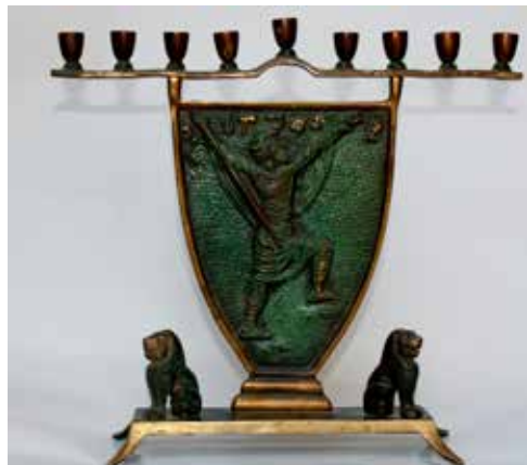
תמונה 25) מנורת חנוכה עם יהודה המכבי, על פי עיצוב של פרדריק קורמיס (לונדון, 1950), ישראל, שנות החמישים של המאה העשרים לערך (אוסף שלום צבר, ירושלים)

(תמונה 25). 57 דימויים אלה מועצמים במנורות אחרות שבהן שורת לוחמים מכבים נושאים את כלי נשקם בסך, ואוחזים ביד אחת את בית הנר או שהוא ניצב מעל ראשם; לעתים הלוחם המרכזי מביניהם אוחז כד שמן, ולעתים תשעת הלוחמים צועדים בסך לכיוון שערי ירושלים המשוחררת. במנורות רבות, בייחוד מתוצרת 'דייג' ו'רות', מופיעים דימויים המאזכרים 'הלון מסכית' (ויטראז') או פסיפס צבעוני, ובהם הלוחמים המכבים נראים במצבים שונים: בסצנות קרב, נחים ליד קבר רחל, יוצקים שמן מכד ובמצבים דומים אחרים (תמונה 26).