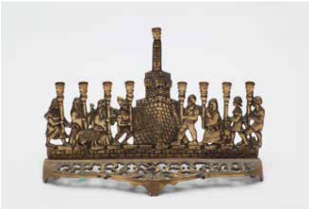
תמונה 30) מנורת חנוכה עם גיבורי העבר וההווה הצועדים לקראת מגדל דוד, 'אופנהיים', ישראל, ראשית שנות השישים של המאה העשרים (אוסף שלום צבר, ירושלים)

נצחון לגבורי ישראל ניני המכבים'. 61 ואכן, באחת המנורות של אופנהיים נראים