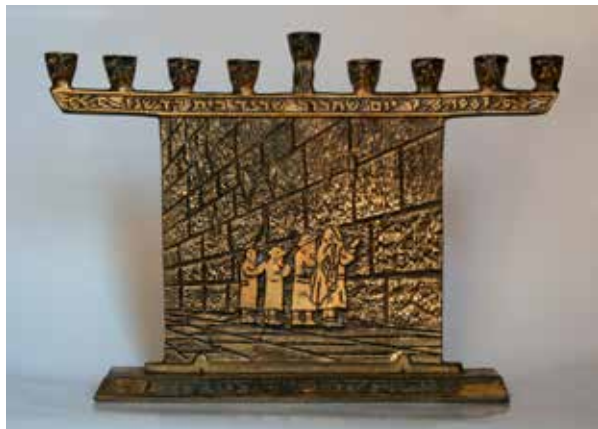
תמונה 31) מנורת חנוכה עם הכותל המשוחרר, ישראל, סוף שנות השישים של המאה העשרים (אוסף שלום צבר, ירושלים)