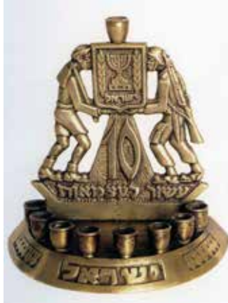
תמונה 29) מנורת חנוכה לעשור למדינת ישראל (1958) עם חייל וחלוץ, ישראל (מוזיאון ארץ ישראל, תל אביב)