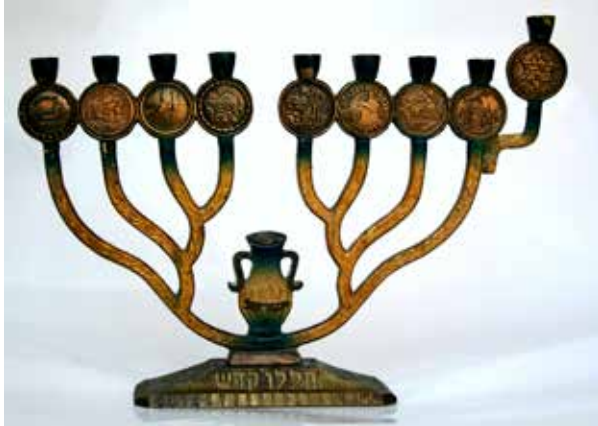
תמונה 21) מנורת חנוכה עם מדליונים של ערי הארץ, מפת הארץ, ומקומות קדושים, 'פאר', ישראל, שנות החמישים של המאה העשרים (אוסף שלום צבר, ירושלים)