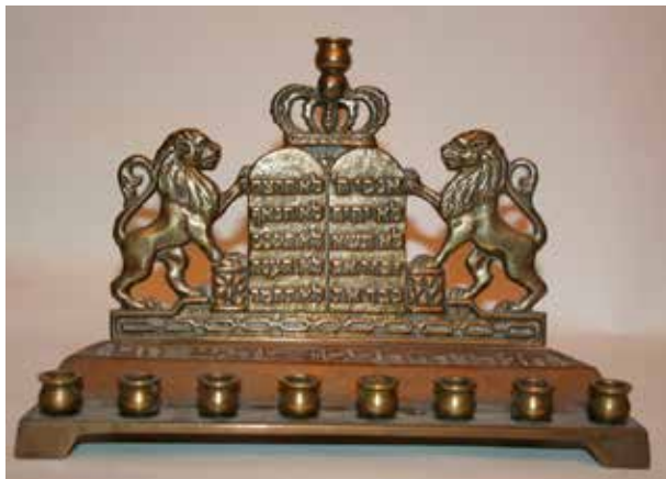
תמונה 10) מנורת חנוכה, ישראל, שנות השישים של המאה העשרים לערך (אוסף שלום צבר, ירושלים)

אלבומי מהודר על אודות מנורות החנוכה הישראליות. 35 עם זאת, הרוב המכריע של המנורות שיוצרו בתקופה זו אינו נושא כל כתובת זיהוי (למעט המילים Made in Israel, אם כי אף כתובת זו אינה מופיעה בכל הפריטים). נדרשת עוד עבודה לזיהוי ולמפוי סגנוני סדיר של היצרנים השונים, ובשורות הבאות ברצוני לדון באחדים מהמוטיבים המרכזיים שעיתרו את מנורות החנוכה החדשות ובמשמעות שנלוותה אליהם.