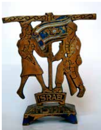
תמונה 28) מנורת חנוכה עם חייל, חיילת ודגל המדינה, ישראל, שלהי שנות החמישים של המאה העשרים (אוסף שלום צבר, ירושלים)

ומעליו השמש (תמונה 29). המסר המידי והברור הוא שהחייל והחלוץ הם בוני המדינה ומשחרריה, ממש כמו המכבים בשעתם. הדבר מובע בצורה מפורשת יותר בדימויים ובאיחולים על כרטיסי ברכה לראש השנה כדוגמת הכרטיס המראה את חיילי צה"ל בשעת קרב. מימין מתתיהו נושא את לפיד המרד, והברכה היא: 'שנת