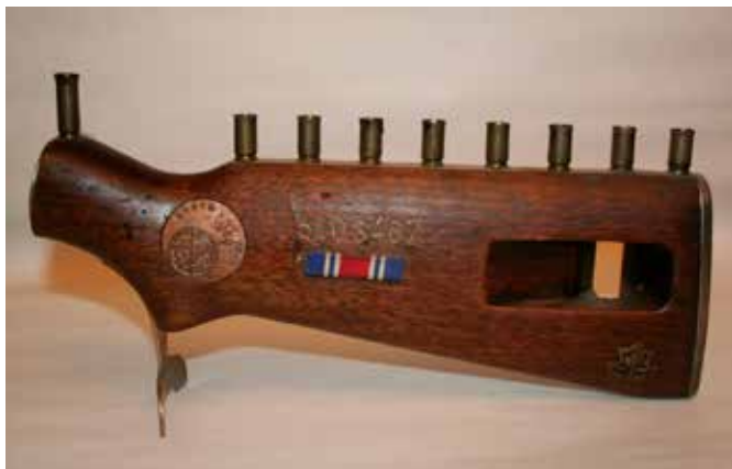
תמונה 32) מנורת חנוכה מקת רובה, ישראל, ראשית שנות השבעים של המאה העשרים (אוסף שלום צבר, ירושלים)

צועדים בסך בני דור המכבים: יהודה, כוהן מוביל שה, זקן וחקלאי קרום, ומולם בצד השני ובהקבלה – חייל צה"ל, רב נושא ספר תורה, חיילת או אישה צעירה