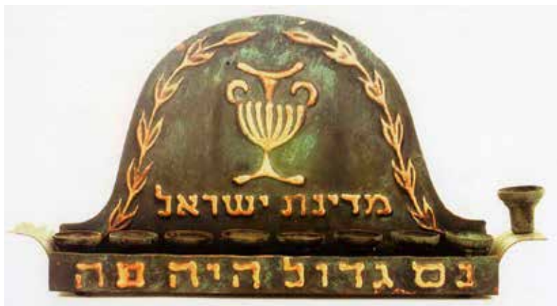
תמונה 18) מנורת חנוכה, עיצוב: יוסף ולרשטיינר, ישראל, ראשית שנות החמישים של המאה העשרים (על פי Lighting the Way to Freedom)

צורניות-חיצונית בשני תחומי היצירה הללו, וכן יש לעתים עדות לתפוצה ולעניין במוטיב זה בשכבות שונות של הציבור בארץ.