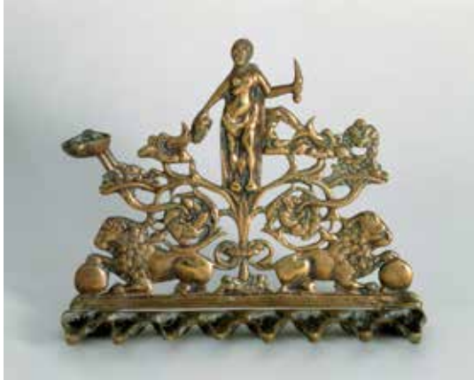
תמונה 2) מנורת הנוכה עם דמותה של יהודית אוחת בראש הולופרנס. איטליה, המאה השבע עשרה לערך (אוסף פרטי, תל אביב)

ובמערכ אינן מאזכרות בעיטוריהן את גבורת החשמונאים. יתרה מזו, המנורות בקהילות השונות אף לא עוצבו בדרך כלל בדמות מנורת שבעת הקנים שעמדה בבית המקדש – בין שעל פי תיאורה המילולי בספר שמות ובין שעל פי תיאורה הוויזואלי בקשת טיטוס (אף על פי שדגם זה נפוץ באמנויות הדקורטיביות באירופה, ולמעשה המנורה שהוגלתה מירושלים לרומא אינה אלא המנורה החשמונאית). 6 במקום גבורת המכבים קושטו המנורות בשלל מוטיבים וסמלים על פי תרבותם החזותית וטעמם של בני המקום והזמן. נושאים אחדים הפכו למאפיינים מובהקים ומרכזיים בעיטור המנורות, הן באירופה הן בארצות האסלאם. כאן יש למנות בראש ובראשונה את עיצוב הדופן האחורית של המנורה, אשר בקהילות רבות נעשה בהשפעת מוטיבים ארכיטקטוניים. כך למשל ארקה של קשתות פרסה מוסלמיות מאפיינת מנורות חנוכה ממרוקו, ואילו דופן המאזכרת חזית של כנסייה או של פאלאצו איטלקיים מתקופת הרנסנס טיפוסית כמובן למנורות איטלקיות של תקופה זו (ולאחריה). 7 מוטיבים ארכיטקטוניים אלה, אף על פי שאינם שאובים ממקורות יהודיים, נועדו לאזכר את מבנה בית המקדש (חנוכת בית המקדש). הבחירה במבנים מוכרים נבעה מהרצון לשוות לבית המקדש מראה של המבנה המפואר ביותר שהכירו בני המיעוט היהודי בסביבה שבה פעלו.