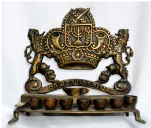
תמונה 14) מנורת חנוכה, ישראל, 1949 לערך (אוסף שלום צבר, ירושלים)

שהוקמה בשילוב של כוח צבאי (ראו להלן) ושל תקווה משיחית המסומלת באמצעות השופרות. 39 יתרה מזו, סמל המדינה בא בבירור למלא את מקומם של סמלי העמים הזרים ששובצו בעבר במנורות חנוכה וייצגו את הנאמנות לשלטון זר. דימוי המנורה וענפי הזית הפך תוך שנים ספורות לאיקונה מוכרת ואהובה אשר הופיעה על מוצרים רבים בתחומים מגוונים, מכרזות וכולים רשמיים ועד לתוויות ואריזות לבקבוקי יין, לשוקולד ולסבון. 40 במייטב המסורת של האמנות העממית, נוח היה למעצבי המנורות לעשות שימוש בדימויים מוכרים ואהובים, אם כי שילוב כל הסמלים בשנים שלאחר קום המדינה הוא מקורי, ולא היה אפשרי קודם לכן. בכך יצרו המעצבים מבנה חדש של דימויים וסמלים שבו קל למתבונן בן הקבוצה לזהות את הקשר עם העבר ובו בזמן להתפעם מרוח ההמשכיות והעכשוויות שמקבץ סמלים זה טומן בחובו. הדברים הללו נכונים במידה רבה גם לגבי סמלים ומוטיבים אחרים שעלו בתקופה זו והפכו למרכזיים על גבי מנורות החנוכה, גם אם היו בעבר נפוצים פחות. כאלה הם למשל סמלי 12 שבטי ישראל – לכאורה נושא קדום ביותר, שהרי המדרש מבסס את מראה הסמלים על פסוקי התורה, ובעיקר על ברכת יעקב