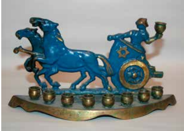
תמונה 24) מנורת חנוכה, ישראל, שלהי שנות החמישים של המאה העשרים (אוסף שלום צבר, ירושלים)

אימצו בשמחה רבה, במישרין או בעקיפין, מוטיבים וקומפוזיציות שהוא פיתח. במנורות של שנות החמישים הולכים ומתרכבים הדימויים של נושאים מהעבר הרחוק: דמויות מקראיות נבחרות, 56 וכן ובראש ובראשונה – החשמונאים. בתי המלאכה המובילים התמסרו רובם ככולם לנושא זה ועיצבו את גיבורי העבר, איש על פי סגנונו וטעמו, אך בהשפעות בולטות זה על זה. לעתים קרובות הדימוי הוא של לוחם חשמונאי בודד, וכאשר הוא מזוהה בשם הריהו שלא במפתיע יהודה המכבי. הגיבור החשמונאי מוצג בדרך כלל כשהוא מזוקן, לבוש בטוניקה צבאית או בשריון בנוסח רומא הקדומה, בידיו הוא אוחז חרב או חנית (לעתים לפיד) ומגן שעליו חרוט באופן אנכרוניסטי מגן דוד. לעתים הגיבור החשמונאי רוכב על מעין מרכבת מלחמה רומית רתומה לסוסים (תמונה 24), אשר במקרים אחדים נדמה כי ההשראה לעיצובה באה מסרטו הפופולרי של ויליאם ויילר 'בן חור' (1959). נוסף על מגן דוד נמצא לעתים שייבוץ של מטבע דמוי מטבע יהודי עתיק, ובמנורה אחת מעל גיבור העבר מופיעים תווים דמויי אותיות עבריות עתיקות שצירופן חסר משמעות