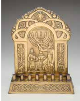
תמונה 7) מנורת חנוכה, קבוצת שראר (עיצוב: זאב רבין?), בצלאל, 1920 לערך (אוסף יצחק איינהורן, תל אביב)

ישראל, שבה נמצאים האתרים. ואכן, לאחר דורות רבים של שכחה, התעורר עניין באתר ההיסטורי של מודיעין ונעשו ניסיונות לאתרו, וכן זוהה האתר המכונה 'קברות המכבים'. עבור צעירי ארץ ישראל בראשית המאה העשרים הטיול לקברות המכבים בימי החנוכה היה מקור לגאווה ולהזדהות עם גיבורי עמם בעבר הרחוק. 20 מגמה זו שהחלה ב'צלאל' הלכה והתחזקה בדורות הבאים, אך לאו דווקא בעיצוב מנורות חנוכה. ביטויים לה נמצא בגלויות ובכרטיסי ברכה לשנה טובה, בכולים ובתעודות ציוניות, בכרזות ובהומר 'תעמולתי', וכן הלאה. 21 המנורות שנוצרו בארץ בעשורים שבין סגירת 'צלאל הישן' (1929) לבין קום המדינה מבטאות שתי מגמות קיצוניות: מחד גיסא מנורות פליז פשוטות של יהדות ארץ ישראל המסורתית, שבהן המשיכו להופיע המוטיבים המוכרים מן הגולה או מהיישוב הישן כמו צמדי