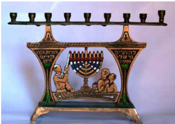
תמונה 27) מנורת חנוכה עם ילדים המדליקים את מנורת המקדש, 'תמר', ישראל, שנות השישים של המאה העשרים (אוסף שלום צבר, ירושלים)