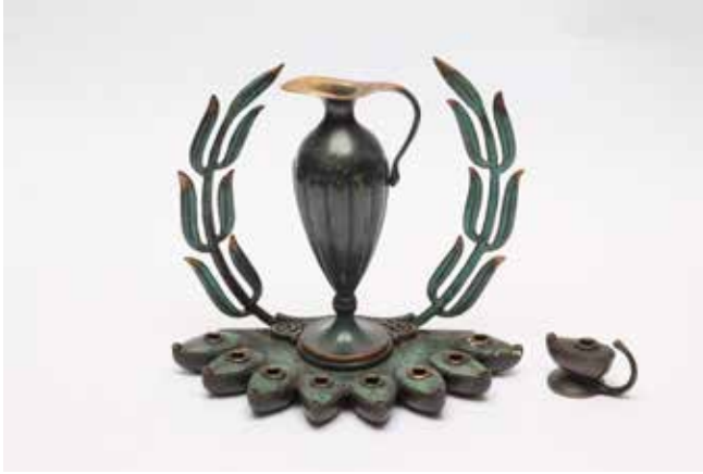
תמונה 17) מנורת חנוכה, תוצרת 'פל-בל' (עיצוב: מוריס אשקלון), ישראל, 1950 לערך (אוסף זאב זוליג, כפר סבא)

ויוראל ולבה (לחזן): 'כַּד קָטָן, כַּד קָטָן, / שְׁמוֹנֵה יָמִים שְׁמֹנוּ נִתֵן. / כָּל הָעַם הַתְּפִלָּא, / מֵאֲלֵיו הוּא מֵתְמַלָּא. // כָּל הָעַם אֶז הַתְּפִנָּס / וְהַכְרִיז: אֶךְ, זְהוּ נִסִּי! / אֱלֹהֵי כַּד זֶה נִשְׂאָר / מִקְדָּשֵׁנוּ לֹא הוּאָר. 45