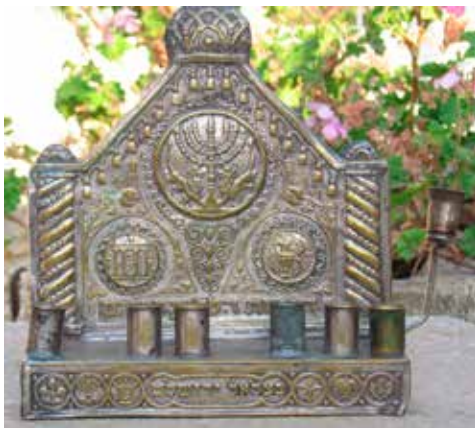
תמונה 6) מנורת חנוכה, קבוצת שראר, בצלאל, ירושלים, 1920 לערך (אוסף שלום צבר, ירושלים)

עבריים עתיקים אשר נתגלו בחפירות ארכאולוגיות בארץ ישראל (תמונה 6). המטבעות נבחרו בקפידה ומשמעותם הסמלית ברורה: הם נטבעו בתקופת שלטון לאומי יהודי בארץ ישראל, ועליהם מוטבעים סמלים יהודיים מובהקים של שלהי תקופת בית שני. מקום מרכזי במנורות אלה תופסים דימויים של מטבעות עתיקים מתקופת מרד בר כוכבא (132–136 לסה"נ). המוטיבים על גבי המטבעות, ובעיקר מוטיב חזית בית המקדש, כמו גם הכתובות באותיות עבריות עתיקות שהועתקו אף הן על המנורות, מנציחים את שחרור ירושלים ואת הניצחון על הרומאים – אות וסמל לעצמאות ולגבורה יהודית נגד שלטון זר. 18