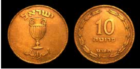
תמונה 19) מטבע '10 פרוטה' עם כד בעל שתי ידידות (על פי מטבע בר כוכבא), הונפק לראשונה ב-4 בינואר 1950 (אוסף שלום צבר, ירושלים)

השמן עצמו וענפי הזית שמהם הופק השמן להדלקת המנורה. ייתכן שההשראה החזותית הישירה לדגם באה מהדימוי על צדו הקדמי של מטבע עשר פרוטות שהונפק לראשונה בינואר 1950 (תמונה 19). 50 עם זאת הקונפיגורציה במנורה של ולרשטיינר מאזכרת בו בזמן ואולי במידה רבה יותר את סמל המדינה, וכדי שהצופה לא יטעה בכוונותיו הוסיף האמן בגדול את המילים 'מדינת ישראל', ואילו בתחתית המנורה מופיעה כתובת נוספת: 'נס גדול היה פה'. לפיכך ברור כי בעיני המעצב של מנורת חנוכה זו נס פך השמן של חנוכה אינו סותר אלא אף מקביל לנס הקמת המדינה. יש לציין כי אין מדובר ברעיון של אמן יחיד, אלא הרעיון מובע בדרכים דומות גם על גבי מנורות אחרות. 51 יתרה מזו, אפילו במנורה שעוצבה בידי חברת 'תמר' עבור הרבנות הצבאית מופיע מוטיב זה, ועל הכד המוקף בענפי זית מופיע סמל צבא ההגנה לישראל – דהיינו הנס מזוהה עם הצבא כפי שנראה גם בהמשך (תמונה 20). דרך הביניים שמצאו מעצבי המנורות, בין האתוס הציוני של העצמה הצבאית והאידיאלים של ההגמוניה לבין סנטימנטים מסורתיים והרקע הדתי של החג, באה לידי ביטוי בתחום נוסף של סמלים שזכה לתפוצה רבה במנורות של דור המדינה: מראות של המקומות הקדושים. אם בעבר מנורות חנוכה בתפוצות הצייגו מבנה ארכיטקטוני מקומי שנועד לסמל את בית המקדש, כעת נפתחה הדרך לשלב דימויים המבוססים על מראות המקומות המקודשים כפי שהם או שרידיהם נראו במציאות.