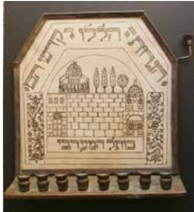
תמונה 4) מנורת חנוכה של 'היישוב הישן' עם דימוי של הר הבית. ירושלים, שלהי המאה התשע עשרה (אוסף פרטי, ירושלים)

המנורה המוצבת באדן החלון או לכיוון הרחוב לשם פרסומי ניסא מודיעה קבל עם ועדה על נאמנותם של בעלי החפץ לשליט המקומי.