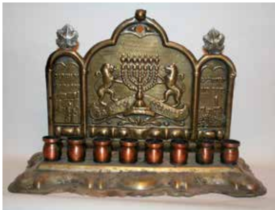
תמונה 23) מנורת החנוכה, עיצוב: זאב רבן, פל-בל, ישראל, 1950 לערך (אוסף שלום צבר, ירושלים)

היוונים (משמאל) וגבורתו של אלעזר בדקרו את פיל אנטיוכוס (מימין). בצד השני, שגם הוא עמוס דמויות ומוטיבים, נמצא במרכז ובהקבלה למנורת המקדש את סמל המדינה; בגבו של הסמל מתנוסס סרט שבו חרוטים מימין סמל "ל ומתחתיו חייל צה"ל, ומשמאל מגן דוד ומתחתיו נערה חלוצה האוחזת במגל; ברקע נראים משמאל בנייני המוסדות הלאומיים בירושלים, ומימין ככל הנראה בנייני האומה. 54 ברישום המקורי של רבן לסצנה זו הוסיף האמן קטעים מרכזיים ממגילת העצמאות. בכך יצר רבן הקבלה מלאה, חדה ובהירה בין מרד המכבים וניצחונם לבין הקמת מדינת ישראל, כאשר המוטיב המקשר בין האירועים הוא מנורת בית המקדש המכבית, היא מנורת החנוכה המקורית, היא הבסיס לדמות המנורה שבסמל המדינה.