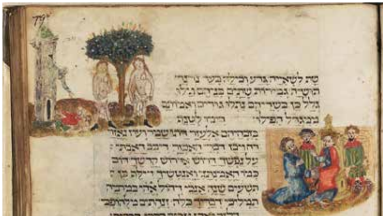
תמונה 1) מות נשים וילדים בעטיין של גזרות אנטיוכוס. איור בכתב יד (המכלול של המבורג), המבורג, ספריית המדינה והאוניברסיטה, כתב יד 37, דף 79א

נבחרו לא רק כאיור לפיוט שנלווה להן אלא משום שעוררו בעיני יהודי אשכנז הזדהות עם הסבל ועם האירועים הקשים שחוו הם ואבותיהם על אדמת גרמניה. גבורת המכבים וניצחונם קיבלו מפנה בלתי צפוי בתרבות החזותית היהודית של שלהי ימי הביניים ותקופת הרנסנס, בעיקר באיטליה ההומניסטית. בתקופה זו עלתה וצמחה בתרבות ובאמנות הכללית דמותה של יהודית – גיבורה נשית אשר בכוח יופייה וחכמתה הצליחה להכניע את האויב האשורי שצר על עירה בתוליה שבשומרון. גיבורה נשית זו, אשר הספר על אודותיה כלל אינו נכלל בקנון של ספרי הקודש היהודיים, אומצה במסורת היהודית לסיפור חנוכה, אף על פי שאינה נזכרת כלל ועיקר בספרי המכבים, ואין לה קשר היסטורי לאירועי התקופה. בהשפעת האמנים הגדולים של הרנסנס אימצו יהודי איטליה את דמותה והפכו אותה, באמנות העממית שלהם, לגיבורה של חג החנוכה. דמותה האיקונית, אוזחת בראשו הכרות של הולופרנס, מעטרת למשל פיוטים לחנוכה בכתבי יד אחדים, ואף מגולפת בתלת-ממד בראשי מגורות חנוכה (תמונה 2). הפופולריות של יהודית בהקשר של חנוכה נמשכה גם בתקופות שלאחר מכן, ומלבד באיטליה, דמותה מופיעה על גבי מספר מגורות מארצות אחרות באירופה, בעיקר מגרמניה. 5 מוחזן לדמותה האפוקריפית של יהודית, שכאמור גם היא מופיעה על גבי מספר קטן של מגורות חנוכה, רובן המכריע של המגורות שנוצרו בקהילות ישראל במזרח