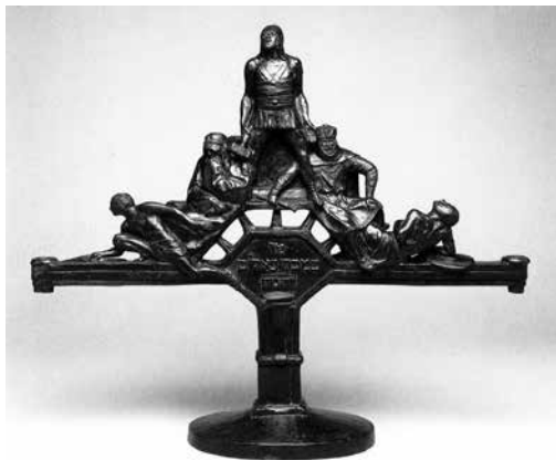
תמונה 9) מנורת חנוכה, בנו אלקן, לונדון, 1950 לערך (שיקגו, מוזיאון ספרטוס)

הנר. הדימוי המרכזי הוא חמש הדמויות ההרואיות של האחים המכבים, מפוסלות בתלת-ממד במבנה פירמידלי קלסי המתנשא מעל שורת כתי הנר. במרכז מתרוממת דמותו של יהודה המכבי, לבוש כלוחם קלסי; לרגלי יהודה כורעים האחים, ממשיכיו לאחר נפילתו: יונתן בדמות כוהן, ושמעון בדמות של הוגה-פילוסוף; בתחתית הפירמידה שוכבים חללי הקרב: אליעזר ויוחנן, אשר נפלו בקרבות החשמונאים. במרכז רגל הבסיס חרוט הפסוק 'מִי־כִמְכָה בְּאֵלֵם יְהוָה' מתוך 'שירת הים' (שמות טו 11), היכול להתקשר עם תשועת האל למכבים, ובו בזמן ראשי התיבות של מילות הפסוק יוצרות את המילה 'מכבי'.