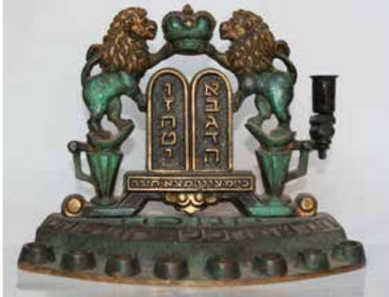
תמונה 13) מנורת חנוכה, ישראל, ראשית שנות החמישים של המאה העשרים (אוסף שלום צבר, ירושלים)

הישראליות לעומת זאת אותה סכמה חזותית יצרה מסר חדש. כך למשל, על אחת המנורות מטיפוס זה לוחות הברית ניצבים על פן שעליו חרוט הפסוק 'כי מציון תצא תורה' (ישעיהו ב' 3), המעמיד את התחייה הלאומית בארץ ישראל כמקור של כוח רוחני וסמכותי (תמונה 13). במנורות אחרות משנות החמישים והשישים, את מקומם של לוחות הברית תופסת לוחית ובה מנורת שבעת הקנים המוקפת בשני ענפי זית – סמל המדינה שנבחר לא מכבר (בפברואר 1949). 37 למען האמת, כבר באחת המנורות המוקדמות ביותר שנוצרה לאחר שהסמל התקבל באופן רשמי הוא מופיע בקונפיגורציה המעידה על המשמעות הרבה ועל הסמליות שהעניקו לו בני התקופה (תמונה 14). מעצבה האנונימי של מנורה זו לא הסתפק בסמל המדינה הניצב במרכז הקומפוזיציה אלא שיבץ אותו בין צמד שופרות ומעליו מופיע סמל הקשור בצה"ל: שילוב של חרב (סמל המלחמה) וענף זית (סמל הכמיהה לשלום). 38 מכלול זה של סמלים משובץ כולו בכתר גדול המוחזק בידי צמד אריות הניצבים על כפותיהם האחוריות והנושא את הכתובת 'כתר מלכות' – דהיינו מלכות ישראל