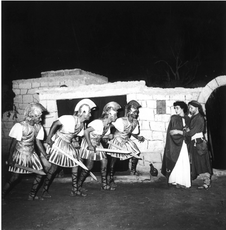
ההצגה בגבעת ברנר