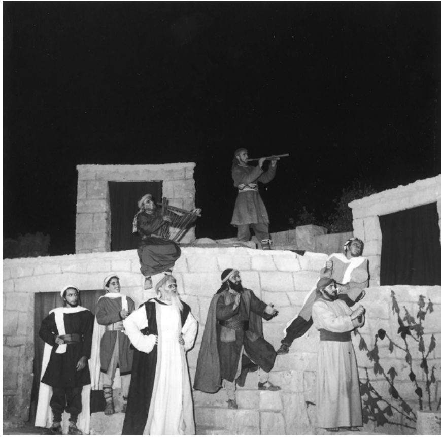
ההצגה בגבעת ברנר