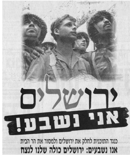
דימוי 4: מודעה, 8.1.2001

וסימל את האופוריה ואת שיכרון הכוח שחשו רבים. הוא שיקף את עוצמתו של החייל הישראלי החזק, הגאה, הבהיר, 'מלח הארץ', ושימש מקור לגאווה לרבים. על פי רוב נלווה לתצלום טקסט מלא הוד ופתוס שכלא אותו בתוך המשמעות הרצויה. כך, לדוגמה, באלבום ששת ימי מלחמת הניצחון תשכ"ז מופיע לצדו הכיתוב: 'דמנו, נשקנו, למענך ירושלים השלמה ממשחררייך'. 25 באלבום מגן ושלח נלווה לתצלום הכיתוב: 'ההתלהבות וההתרגשות גאו כים עובר על גדותיו [...] כותל הדמעות, כותל האבן והיגון היה לכותל הניצחון'. 26 התצלום מופיע במרומו בשירו של חיים חפר 'הצנחנים בוכים' שבספר מסדר הניצחון, 27 בתערוכה של משרד ראש הממשלה 'כך חושל הכח', 28 שהופצה ונתלתה בכתי הספר כתערוכה נודדת, ושנים מאוחר יותר גם על כריכת הספר ישראל 50, 29 לצד דימויים ישראלים מכוננים אחרים. הוא פורסם כתצלום מלא, בחיתוך או כצללית. עד היום אפשר