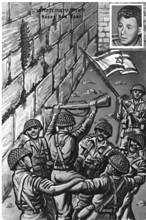
דימוי 3: כרטיס ברכה לראש השנה, הוצאת מרכז התמונות תל-אביב

הם מלמדים כיצד השפיעה התפיסה ההגמונית על הפרט וכיצד אומצו השקפתה ומרכיביה של תפיסה זו במרחב האזרחי. האופוריה ושכרון הכוח סחפו חלקים גדולים מהציבור הישראלי שהיה במקרים רבים נעדר חוש ביקורת. 20 אם אלכס ליבק ייזכר בזכות תצלום 'פרשת קו 300', אזי דויד רובינגר ייזכר בעיקר בזכות 'הצנחנים ליד הכותל'. רובינגר צילם את תמונת הצנחנים עם כיבוש הכותל, במסורת הצילום המגויס של טרם הקמת המדינה. הם צולמו מלמטה תוך האדרת דמותם. הם נראים 'גדולים מהחיים', חזקים, אותות המלחמה אינם ניכרים בפניהם. החייל במרכז – יפה, בהיר עור, קורן, משדר עוצמה, רעננות וחוסן פנימי, גילם בדמותו את כל התכונות שהצבר ביקש להגשים ואת כל התכונות שהישראלים, כאמור, ביקשו להזדהות