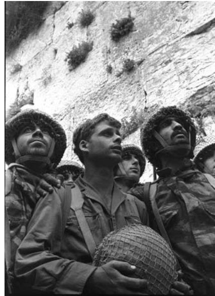
דימוי 1: דויד רובינגר, הצנחנים ליד הכותל עם כיבוש, 7.6.1967

ולא לתצלום אחר מאותו אירוע, להיות בעל משמעות במרחב הציבורי. שלישיית, להדגים את השימוש בתצלום בהבניית המשמעות והמסר.