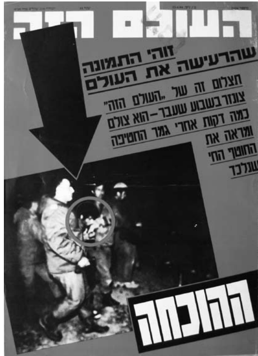
דימוי 10: כריכת העולם הזה, 25.4.1984

מפוכחת שאינה מוכנה לקבל יותר את שליטתה המוחלטת של המערכת השלטונית ופתוחה לקולות אחרים ולראייה אלטרנטיבית. 48 סוזן סונטאג טוענת כי 'מה שקובע את האפשרות להיות מושפע מבחינה מוסרית על ידי תצלומים הוא קיומו של מצפון פוליטי רלוונטי. בלא הפוליטיקה, תצלומי בית המטבחים של ההיסטוריה יתפסו, פשוט, כבלתי ממשיים או כפגיעות אמציונאליות מייאשות'. 49 לדעתה, ללא קיומו של הקשר מתאים של רגש וגישה, לא יטביע תצלום חותם על דעת הקהל. היא טוענת כי האמריקנים הושפעו ממראות הסבל הווייטנמי מפני שרבים האמינו שזוהי מלחמה קולוניאלית אכזרית שאין לה הצדקה. היא מביאה דוגמה זו בניגוד לתצלומים ממלחמת קוריאה המתארים זוועות, הרס וחורבן, שלא עוררו מחאה, שכן מבחינה אידאולוגית לא היה להם מקום. מלחמת קוריאה נתפסה כחלק מהמאבק של העולם נגד ברית המועצות של אז וסין.