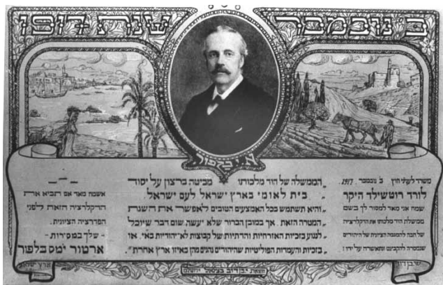
גלויה שעוצבה ב'בצלאל' בעקבות הצהרת בלפור, נובמבר 1917