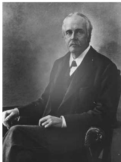
ארתור ג'יימס בלפור, 1.11.1917

אולם יום זיכרון הוא לנו יום זה. ציון רב ערך להיאבקותנו על גאולתנו הלאומית'. בן-גוריון פירט את המשמעויות העיקריות של הצהרת בלפור וסיכם כי עתה ניתן לפעול ביתר ביטחון מאשר לפני 25 שנה, 'בקומה זקופה כאומה הדורשת מלוא זכויותיה'. מנגד הדגיש הרצוג אלמנט אחר: 'אנו מסתייעים בהצהרת בלפור, אך לא בה נתחיל. ראשיתנו נעוצה בהבטחה שניתנה לפני יותר מ-60 יובלות על ידי ה' לאברהם אבינו. העולם יקום מחדש על יסודות תרבות, על יסודות חסד אמת ושלוש שהונחו לפני שלושת אלפים שנה. האומות לא תוכלנה להתעלם מזכותנו על ארץ ישראל'. 34 בשני הנאומים המרכזיים הללו אפשר היה לאתר את הפרשנויות השונות