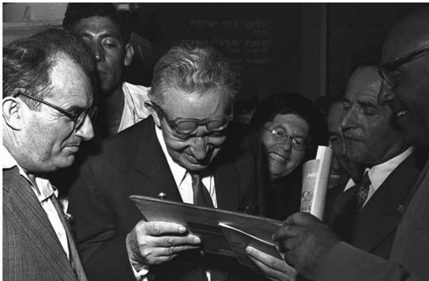
נשיא המדינה, יצחק בן-צבי, ורעייתו רחל ינאית, מסיירים בתערוכה, 22.9.1953

בשנת 1951 מפעל לפיתוח אזורים צחיחים, שליידו הוקמה ועדה מדעית מייעצת. הארגון הכריז על מאבק במדבור ועל הפיכת אזורים שוממים לאזורים נושבים כנושא המרכזי שבו הארגון יעסוק באינטנסיביות בשנות החמישים. עוד נקבע כי כל שנה תוקדש לפעילות בנגזרת אחרת של נושא המאבק במדבור. התערוכה והיריד בירושלים, והכינוס האקדמי שאמור היה להתקיים בצמוד לתערוכה, היו חלק מפעילות זו. 9 ישראל השתלבה בפעילות אונסק"ו הן בצד האקדמי והן בצד הביצועי, שנבע גם מהאידאולוגיה הציונית. במבט על אפשר לטעון כי ההצעה הישראלית להקים יריד ותערוכה בנושא כיבוש השממה, הייתה חלק אינטגרלי מדפוסי החשיבה והמתרחש במדינה. אולם בדיקה מעמיקה מראה שהיו סיבות נוספות לקיום התערוכה, הקשורות למאמץ המדיני לחיזוק מעמדה של ירושלים כבירת ישראל.