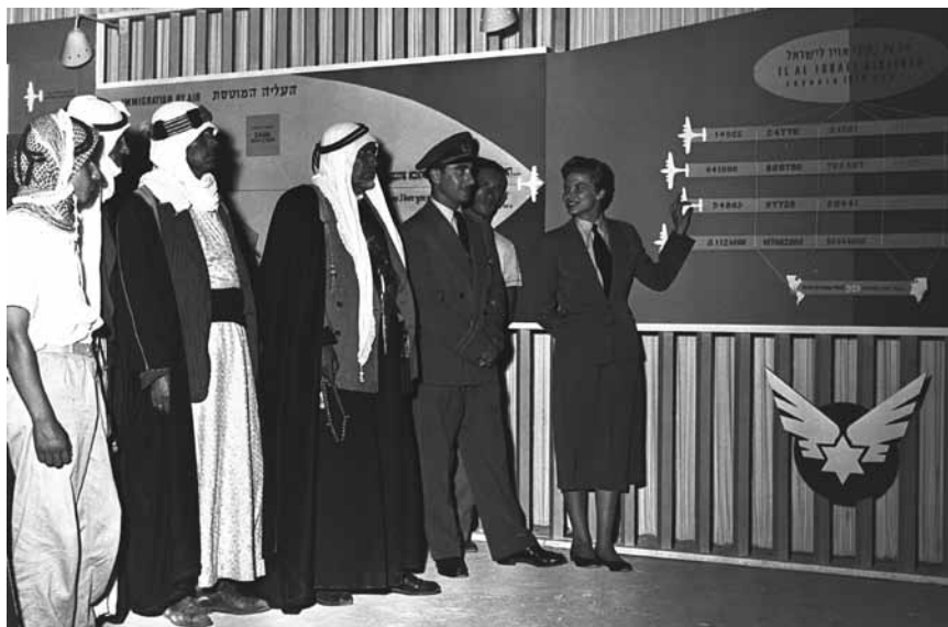
ביתן חברת 'אל על' בתערוכת כבוש השממה, 22.9.1953

בחירת התערוכה ומשמעותה מעידות על שני תהליכים מקבילים. התהליך הראשון מתייחס להתרחשויות הפנים ישראליות; התהליך השני מתייחס למשמעויות הבינלאומיות של קיום התערוכה. בהיבט התרבותי הישראלי, נהירת הקהל הישראלי לתערוכה הייתה חסרת תקדים במושגי ישראל בשנת 1953. נהירה זו, על אף הדברים הבוטים שנכתבו על התערוכה בעיתונות התקופה, מעידה כי מעצבי דעת הקהל לא ביטאו את יחסו האמיתי של הציבור לאירוע. כל העדרויות מצביעות על כך שקהל המבקרים בא באופן עצמאי. אין להתעלם מכך שהיה גם לא מעט קהל שבוי שהובא למקום על ידי ועדי עובדים וההסתדרות. אפשר לקבוע שהציבור הישראלי על כל רבדיו היה שותף פעיל בתערוכה אם כמבקר, אם כמציג, אם כקונה מניות החברה ואם בעובדה שאמנים רבים היו שותפים לתכנון התערוכה ולהפקתה. למרות ההפסד הכלכלי האדיר שהתערוכה הסבה לתקציב המדינה, הציבור לא עסק בהיבט זה, למעט עיתונות אופוזיציונית. יתרה מזאת, נראה שקיומה של תערוכה העוסקת בפן הכלכלי המצליח בתקופת מחסור קשה הצביע על הרצון האופטימי של הציבור להשתתף בנרטיב הציוני החיובי הבונה את המיתוס המכונן של המדינה. עיקר חשיבותה של התערוכה הייתה בהיבט הבינלאומי של עצם קיומה, בהשתתפות כמו גם באופי אי ההשתתפות של המדינות והארגונים. התערוכה הפכה לנייר לקמוס שאמור היה לבדוק את התגובה הבינלאומית למהלכיה של ישראל בירושלים. והיו מדינות שהשתתפו וחברות מסחריות בינלאומיות שנטלו בה חלק. היה ניסיון ברור לקיים חרם על ישראל בהובלת ארצות הברית ובריטניה עקב מעבר משרד החוץ לירושלים. נקודה זו