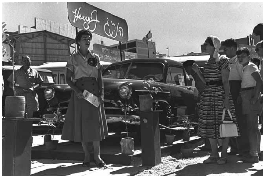
מכונת 'קייזר פרייזר' ב'תערוכת כבוש השממה', 22.9.1953

החדשים ביותר המיוצרים לא רק בארצות תעשייתיות גדולות כגון ארצות הברית ואנגליה אלא גם בלגיה, הלווטיה (שווייץ), שוודיה וארצות אחרות'. לקהל הובטח כי מיטב החברות המסחריות תצגנה בתערוכה. הפרסום הדגיש כי לא מדינות מציגות אלא חברות מסחריות. 99 בדיווח העיתונאי על התערוכה הדגישו את הפעילות של החברות המסחריות. כך נכתב בהתפעלות על מגווע הסילון שהציגה חברת 'רולס רויס'. 100