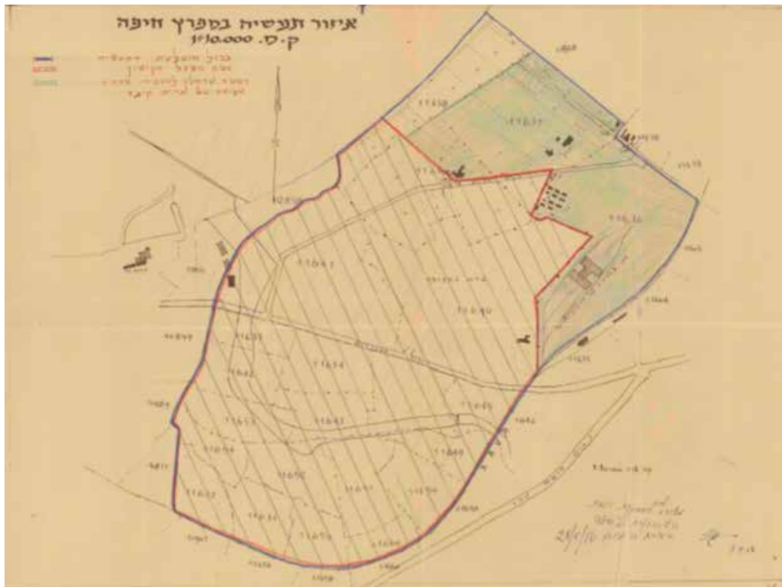
איור 4: מובלעת התעשייה והשטח שסופח לחיפה ב-1956

במפורש או על ידי הוצבת תנאים מרחיקי לכת כמו העברת חלק מאזור התעשייה מחיפה לידי העירייה החדשה. אחת מטענות המתנגדים הייתה שלא יחודר המוצע לא תהיה היתכנות כלכלית ללא אזור התעשייה, שעליו סרבה עיריית חיפה לוותר. 180